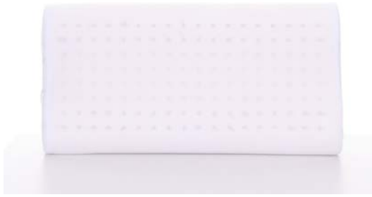
ภาพที่ 2 แสดงผลิตภัณฑ์หมอนยางพาราเพื่อสุขภาพสำหรับเด็ก