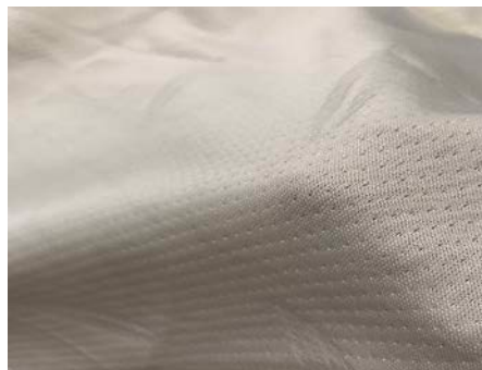
ภาพที่ 3 แสดงผลิตภัณฑ์ปลอกหมอนผ้ากันไรฝุ่น

เป็นปลอกหมอนผ้ากันไรฝุ่น โดยใช้เทคโนโลยีการทอแน่นเพื่อให้ระยะห่างของเส้นด้ายมีขนาดเล็กป้องกันไรฝุ่นและมูลซึ่งเป็นสารก่อภูมิแพ้ ออกแบบให้พอดีกับรูปทรงของหมอนตามแต่ละทรง โดยมีปลอกหมอน 2 ขนาด สำหรับหมอนเด็ก และหมอนผู้ใหญ่